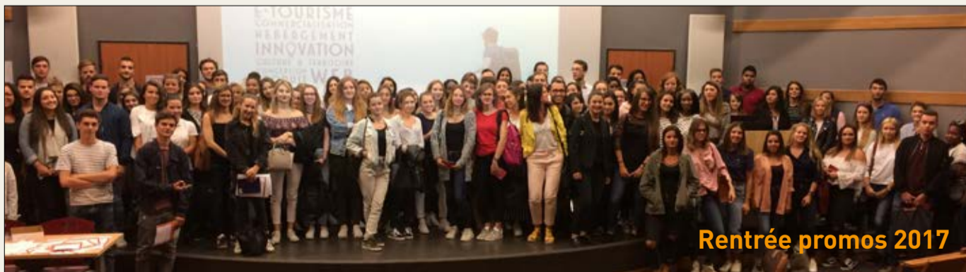
Rentrée promos 2017